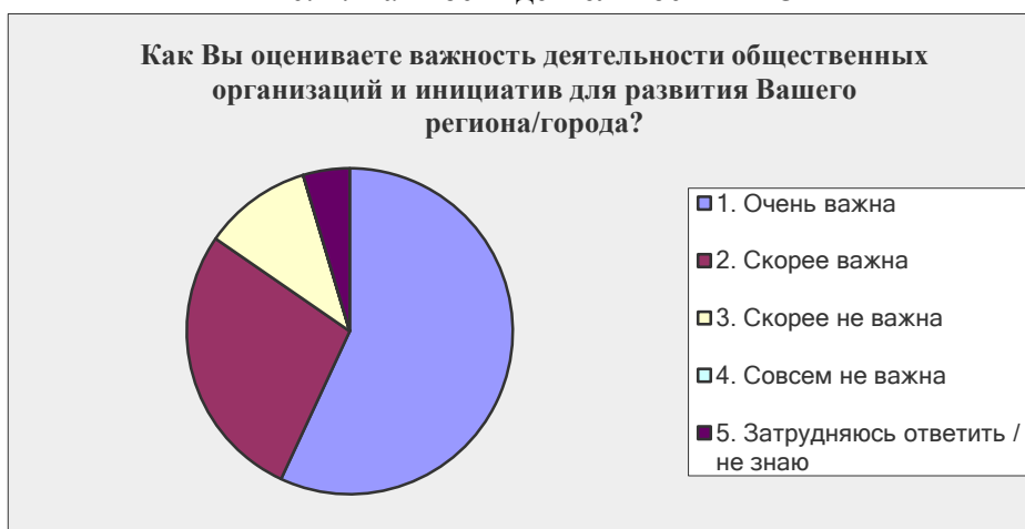
Рис. 1. Важность деятельности НГО

Отвечая на вопрос «Как Вы оцениваете важность деятельности общественных организаций и инициатив для развития Вашего региона/города?» (см. рис. 1), более половины (57%) респондентов предпочла ответ «очень важна», а вместе с ответами «скорее важна» сторонники такого взгляда составили абсолютное большинство (85%). Причем, сторонников позиции «скорее не важна» среди группы ГУ почти четверть, в то время как среди НГО – только 5%.