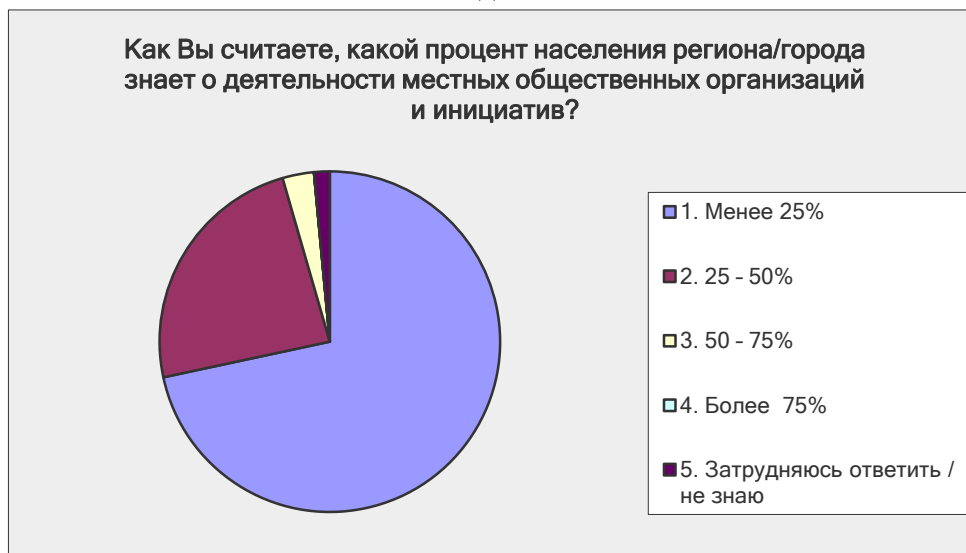
Рис. 2. Знание о деятельности НГО

четверти населения знают об этом. Еще почти 24% считают, что об этом знают от четверти до половины жителей.